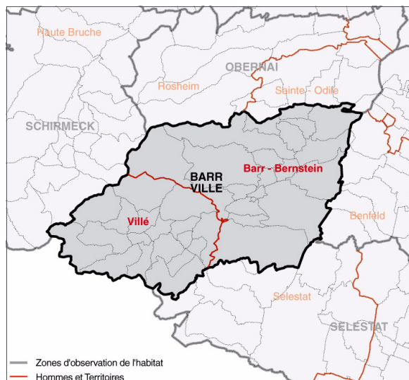
Source ADEUS, Observatoire départemental de l'habitat, 2008.

Cette étude a été réalisée entre décembre 2007 et mai 2008.